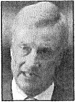
Ole von Beust